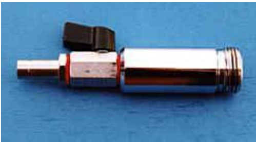
23.001- 不锈钢底管 带阀门，容积 35ml

网衣上半部分由强化尼龙纤维制成。网衣网目从 5-500 \mu m 不等，订购时请注明。