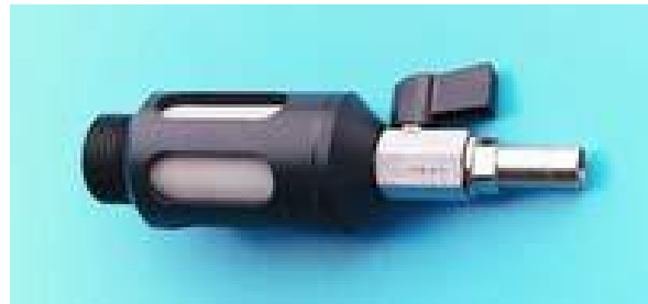
23.004- PVC 底管 5 个出水口，上面覆盖筛绢，容积 80ml